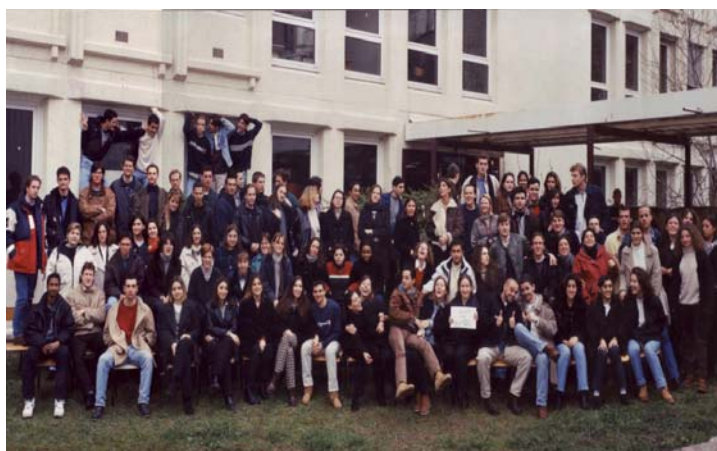
La promo GEA de 1998

le départ aura lieu vendredi 10 octobre à 17h30 devant l'IUT.